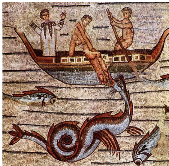
Mosaico del sec. III raffigurante il profeta Giona gettato in mare: “figura” e “typus” dei migranti gettati nel Mediterraneo, come inutile zavorra, dagli scafisti “furciferi” (cf. C. Egger, Lexicon Lat. hodiernum , p. 111 ) del XXI secolo.